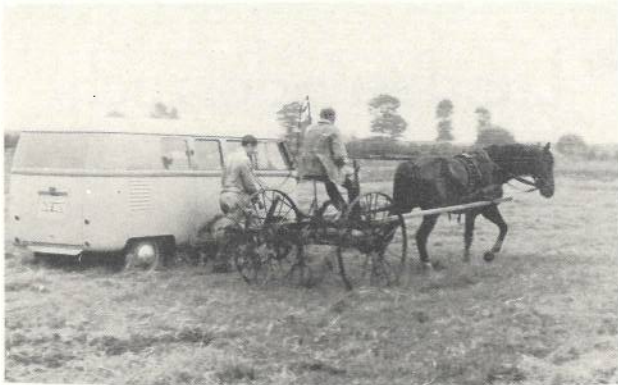
Abb. 4. Die elektrischen Messgeräte zum Aufzeichnen der Beanspruchungen sind in einem Messwagen eingebaut, der neben der untersuchten Maschine fährt.

Zinkens von weniger als 1/1000 Millimeter während der praktischen Arbeit auf der Wiese – also bei grosser Geschwindigkeit – messen und als Kurve unmittelbar aufschreiben. Die Messgeräte sind in einem Messwagen eingebaut, der neben dem Heuwender herfährt und durch ein Kabel mit ihm verbunden ist (Abb. 4).