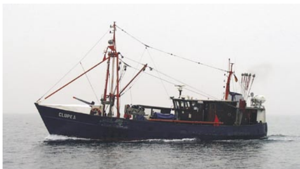
Abb. 2: Mit FFK Clupea dem Heringsnachwuchs auf der Spur - Haunting herring larvae with RV Clupea.

Grundlage für fischereipolitische Entscheidungen im Sinne einer nachhaltigen Nutzung der marinen Ressourcen zur Verfügung – sowohl im Sinne des Erhalts einer gesunden natürlichen Umwelt als auch des Erhalts einer nachhaltigen wirtschaftlichen und sozialen Umwelt für die deutsche Kutter- und Küstenfischerei.