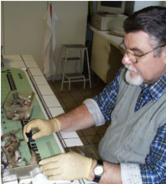
Abbildung 1: Ansicht des elektronischen Messbretts bei der Erzeugung von Fischlängendaten

Der Magnet löst berührungslos auf einem der im Inneren des Messbretts befindlichen magnetisch induktiven Sensor den zugehörigen Längenmesswert aus und meldet dieses auch akustisch und optisch dem Anwender. Dieser Messwert wird zusammen mit anderen zugehörigen Daten wie Fischartname, Nummer der Messreihe, Messreihengewicht etc. gespeichert. Diese zugehörigen Daten können über vorher vom Anwender definierte oder dafür fest vorgesehene magnetisch auszulösende Schal-