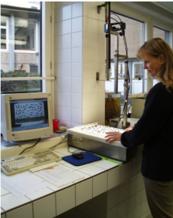
Abbildung 2: Ansicht des Bildverarbeitungssystems beim Erstellen von Garnelenbildern für die Längenberechnung von Garnelen

Beispielhaft sind in den Abbildungen 3 und 4 Schollen- und Garnelen-Längendaten aus einer 6-tägigen Beifanguntersuchung in der Garnelenfischerei im Juli 1999 dargestellt. Für die Untersuchung von Fangunterschieden zwischen unterschiedlich selektiven Netzen wurden die Schollenlängen auf dem elektronischen Messbrett, die Garnelenlängen mit Hilfe des Bildverarbeitungssystems bestimmt. Alle Daten wurden in eine gemeinsame Datenbank eingelesen und von dort für die Kurvenerstellung unterschiedlicher Fanganteile von Baumkurrennetzen wieder herausgefiltert.