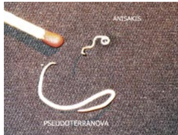
Abbildung 4: Pseudoterranova decipiens aus Stinten im Vergleich zu Anisakis sp. aus Heringen.

man bei den Stinten die NL fast ausschließlich im Muskelfleisch (Tab.4). Von den 63 gezählten Larven waren nur 5 % in den Eingeweiden. Hier gibt es offensichtlich Unterschiede zwischen den Nematodengattungen. Hering und Makrele werden fast ausschließlich von Anisakis simplex befallen, während Stinte bevorzugt Pseudoterranova decipiens beherbergen (Abb. 4). McClelland (2002) berichtet, dass mit der Nahrung aufgenommene Pseudoterranova decipiens innerhalb kurzer Zeit in die Muskulatur abwandern.