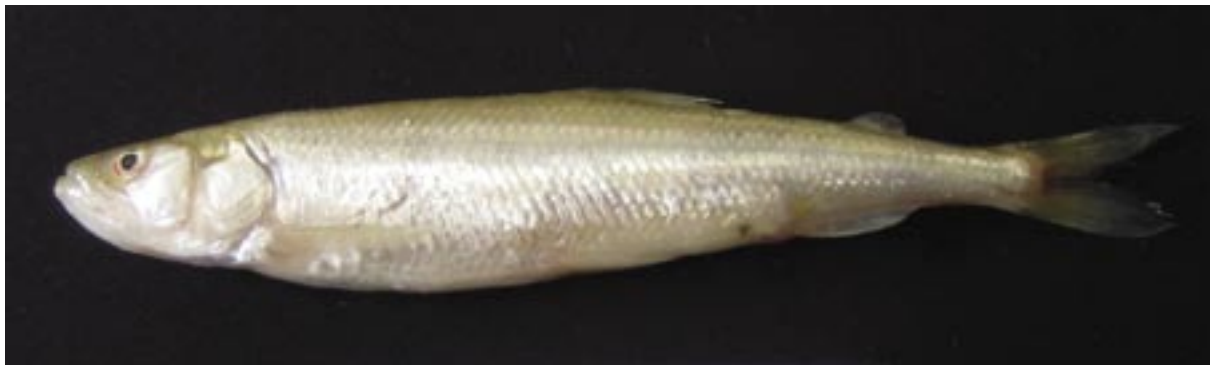
Abbildung 1: Stint ( Osmerus eperlanus L.).