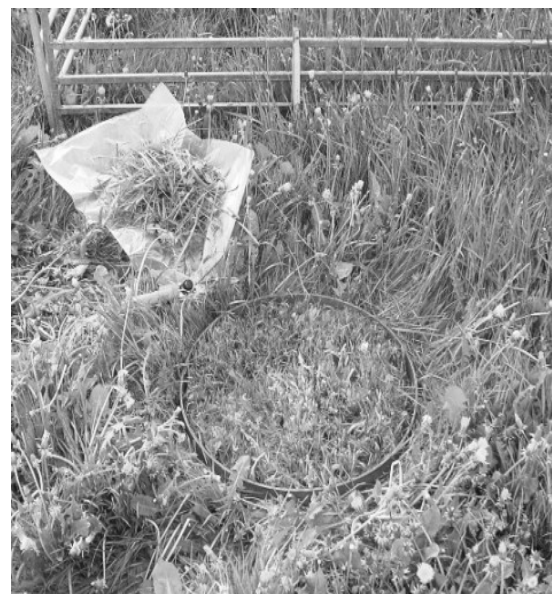
Abbildung 2: Probenahme auf der Weide

In zweiwöchigem Abstand erfolgte exemplarisch eine Heuaufnahmemessung. Dafür wurde ein Rundballen auf einer elektronischen Viehwaage (max. 2000 kg, \pm 0,5 kg Stufung) verwogen und die auf dem Futtertisch verbliebenen Restmengen nach 24 Stunden durch Rückwiegung mittels Sisal-