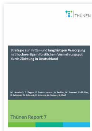
„Züchtungsstrategie“ (Thünen Report 7, 2013)

Bei der Kiefer sollen die umfangreich vorhandenen Herkunftsversuche sowie die Versuche zur Prüfung von Bestandesabsaaten und Nachkommenschaften für die Auswahl der Zuchtbäume genutzt werden. Dabei wird überwiegend auf vorhandene Daten zurückgegriffen. Bei den Versuchen mit Herkünften und Bestandesabsaaten liegt das Hauptaugenmerk auf der Selektion von überdurchschnittlich wüchsigen und gutgeformten Kiefern innerhalb der besten Prüfglieder der jeweiligen Versuchsserien. Die Auswertung der Nachkommenschaftsprüfungen erlaubt die Ermittlung eines Zuchtwerts und der Kombinationseignung von Ausleseebäumen. Bäume mit gutem Zuchtwert können für den Aufbau neuer Samenplantagen genutzt werden. Auf diese Art und Weise ist es relativ schnell möglich, einen züchterischen Gewinn für die Praxis verfügbar zu machen.