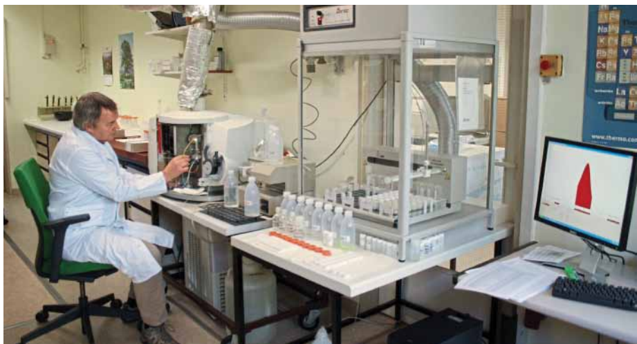
Messung von Bodenaufschlusslösungen am Plasmaspektrometer.

Zur Vorbereitung der BZE II wurde vom Bundes-Landwirtschaftsministerium 2002 der Gutachterausschuss Forstliche Analytik eingesetzt, um zum einen die Analysemethoden zu vereinheitlichen, festzulegen und zu dokumentieren und zum anderen ein Qualitätskontrollprogramm für die BZE II zu entwickeln und festzulegen.