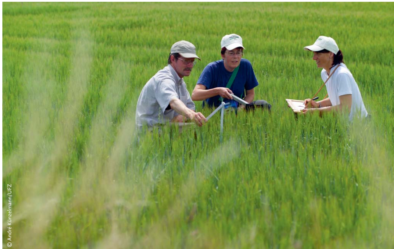
ABBILDUNG 2: Wie hoch ist die Artenvielfalt auf landwirtschaftlichen Flächen und wie entwickelt sie sich in den nächsten Jahren? Forscher(innen) des Helmholtz-Zentrums für Umweltforschung – UFZ bereiten die Erfassung von Tier- und Pflanzenarten vor.