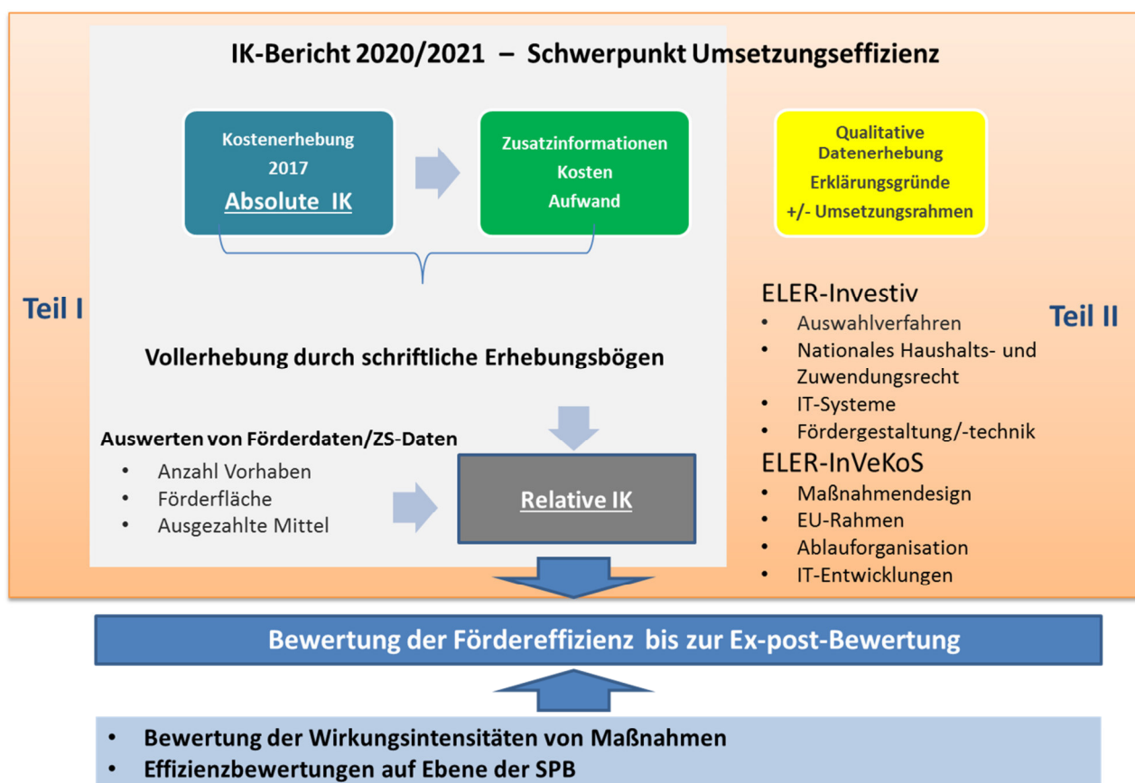
Abbildung 1: Analytischer Rahmen und Untersuchungsfelder der Implementationskostenanalyse

In der Programmbewertung liegt ein Schwerpunkt bei der Implementationskostenanalyse (IK-Analyse). Kern der IK-Analyse bildete die in 2018 durchgeführte schriftliche Erhebung des Umsetzungsaufwandes bei den mit der Förderung betrauten Verwaltungsstellen. Die Fragebögen waren spezifisch auf die verschiedenen Ebenen bzw. Förderstränge zugeschnitten. Sie beinhalteten neben der Erfassung des Personalaufwandes (soweit relevant getrennt nach Förderabwicklung, Vor-Ort- und Ex-post-Kontrollen) auch Fragen zu den aufwandsbestimmenden Merkmalen der aktuellen Förderperiode. Im Berichtszeitraum lag ein Schwerpunkt in der Auswertung der schriftlichen Erhebung und dem Zuspielen der Auszahlungsdaten zur Ermittlung der relativen IK. Die Informationen aus der schriftlichen Erhebung werden zurzeit in einem Bericht zusammengestellt (Teil I). Ergänzend sind weitere Untersuchungsschritte geplant, die auf dem Lenkungsausschuss im November 2019 abgestimmt wurden. Die Untersuchungsschwerpunkte werden sich nach flächenbezogenen und investiven Maßnahmen unterscheiden (siehe Abbildung 1).