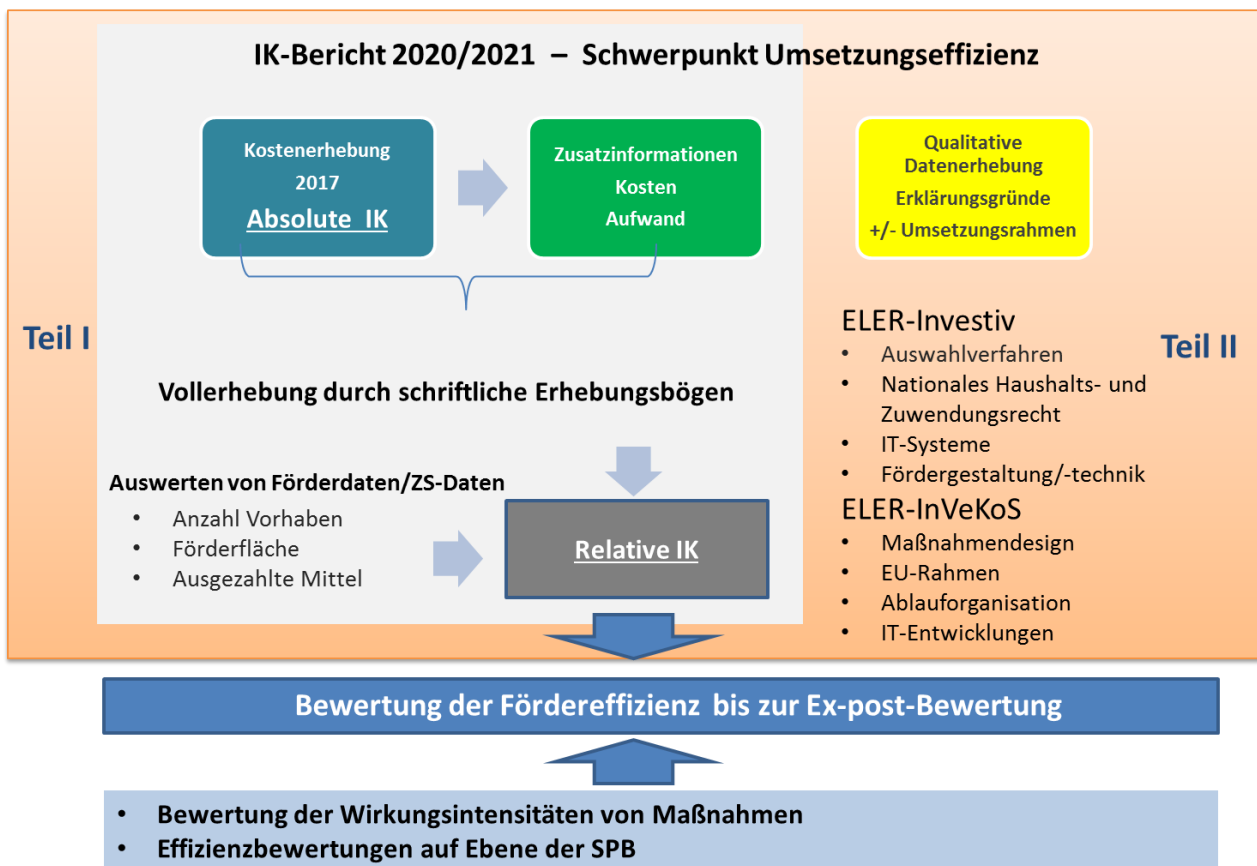
Abbildung 1: Analytischer Rahmen und Untersuchungsfelder der Implementationskostenanalyse

In der Programmbewertung liegt ein Schwerpunkt bei der Implementationskostenanalyse (IK-Analyse). Kern der IK-Analyse bildete die in 2018 durchgeführte schriftliche Erhebung des Umsetzungsaufwandes bei den mit der Förderung betrauten Verwaltungsstellen. Die Fragebögen waren spezifisch auf die verschiedenen Ebenen bzw. Förderstränge zugeschnitten. Sie beinhalteten neben der Erfassung des Personalaufwandes (soweit relevant getrennt nach Förderabwicklung, Vor-Ort- und Ex-post-Kontrollen) auch Fragen zu den aufwandsbestimmenden Merkmalen der aktuellen Förderperiode. Im Berichtszeitraum lag ein Schwerpunkt in der Auswertung der schriftlichen Erhebung. Die Informationen aus der schriftlichen Erhebung werden zurzeit in einem Bericht zusammengestellt (Teil I). Ergänzend sind weitere Untersuchungsschritte geplant, die auf dem Lenkungsausschuss im November 2019 abgestimmt wurden. Die Untersuchungsschwerpunkte werden sich nach flächenbezogenen und investiven Maßnahmen unterscheiden (siehe Abbildung 1).