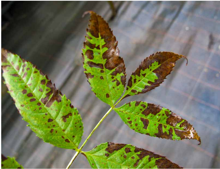
Abb. 4: Blattnekrosen nach Pilzinfektion beim „Sporentest“

fig zum Absterben. Indem jährlich neue Infektionen stattfinden, stirbt die Krone der Esche schrittweise von außen nach innen zurück. Daneben verursacht der Pilz zungenförmige Nekrosen am Stammfuß und Wurzelhals der Eschen. Weiterhin treten bei den infizierten – und damit geschwächten – Eschen nach kurzer Zeit Folgeschädlinge – insbesondere Hallimascharten oder der Eschenbastkäfer – auf, die das Absterben der Esche beschleunigen [3]. Neben der Infektion über das Blatt wird auch das direkte Eindringen des Pilzes über Lentizellen der Esche angenommen [2].