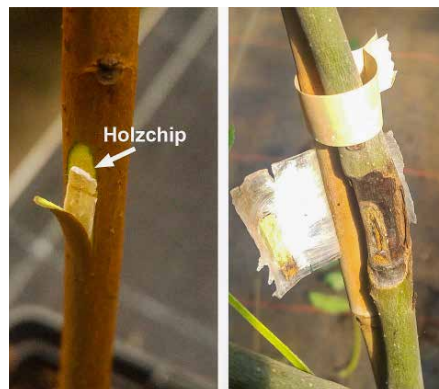
Abb. 5: Fixierung des Holzchips am Trieb [l.] und erste Infektionssymptome [r.]

Von besonderer Bedeutung ist die Beobachtung, dass auch bei anhaltend hohem Infektionsdruck in den Beständen vereinzelt Eschen vorkommen (<5 % der Population), die keine oder nur geringe Symptome des Eschentriebsterbens zeigen (Abb. 1). Es treten somit im Verlauf der Erkrankung einzelne Bäume hervor, die erkennbar über eine hohe Widerstandsfähigkeit gegenüber dem Pilzbefall verfügen. Darauf ausgerichtete spezielle Untersuchungen konnten belegen, dass diese Form der Resistenz genetisch bedingt und vererbbar ist [1]. An diese Erkenntnis knüpft die Idee des Projekts „ResEsche“ an, indem gegenüber dem Krankheitserreger nachweislich widerstandsfähige Genotypen der Esche selektiert und in einer Samenplantage zusammenge-