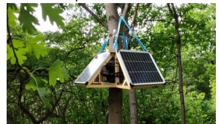
Abb. 2: Beispiel einer Datenaufnahme im 5G Smart Country Projekt (Ostfalia Am Exer, Wolfenbüttel; Quelle: https://5g-smartforestry.ostfalia.de ).

Beispiel 3: Im Projekt 5G Smart Country soll mittels intelligenter Waldsensorik und einer 5G-Anbindung der Waldzustand mit Blick auf ein nachhaltigeres Wirtschaften im Klimawandel vermessen werden (Abb. 2). In Kooperation mit den Projektpartnern des Projektes 5G Smart Country und den Landkreisen Wolfenbüttel und Helmstedt wurden für das Teilprojekt Smart Forestry Daten auf Versuchsflächen gesammelt und frei zugänglich grafisch aufbereitet.