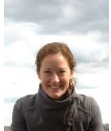
© Anne Reichmuth, Helmholtz Zentrum für Umweltforschung - UFZ

Das geht leider aufgrund von Lizenzierungsfragen nicht. Wir planen die Verfügbarmachung der Karten im Rahmen der wissenschaftlichen Veröffentlichung, welche aktuell in Arbeit ist. Die Einbindung als WMS-Karte (Web Mapping Service) ist aber möglich.