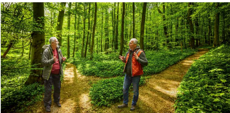
Abb. 1: Am forstlichen Scheideweg wird eine professionelle forstliche Beratung für den Kleinprivatwald angesichts aktueller und zukünftiger Herausforderungen immer wichtiger.

Als Themenfelder für eine bessere oder umfangreichere Beratung in der Zukunft werden von den KPWE am häufigsten die Waldpflege, der Naturschutz, der Klimaschutz sowie der Waldumbau (d. h. die Veränderung der Baumartenzusammensetzung) genannt.