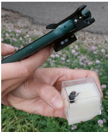
ABB. 2 Eine Hummel wird in einem Beobachtungswürfel bestimmt und fotografiert.

Zusätzlich zu den Hummeln werden auch die Pflanzen dokumentiert, auf denen die Hummeln gefangen wurden. Hierbei handelt es sich zumeist um Ruderalpflanzen, die insbesondere in intensiv bewirtschafteten Landschaften für Hummeln eine wichtige Nektar- und Pollenquelle darstellen. Dazu zählen beispielsweise die zu den Lippenblütlern (Lamiaceae) zählenden Taubnesseln und die zu den Hülsenfrüchtlern (Fabaceae) gehörenden Klearten. Aus diesen Interaktionsdaten lassen sich dann Informationen zur Ressourcennutzung der Hummeln in der Agrarlandschaft ableiten.