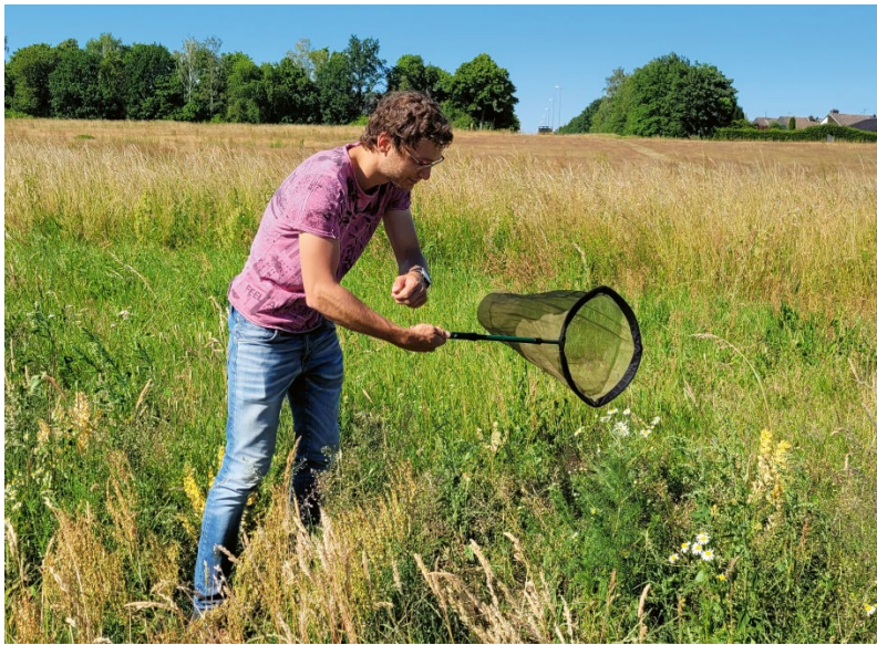
ABB. 1 Sichtfang einer Hummel während einer Transekt-Begehung.

Forschende am Thünen-Institut für Biodiversität entwickeln ein bundesweites Monitoring von Hummeln in Agrarlandschaften. Gemeinsam mit zahlreichen Ehrenamtlichen werden dafür regelmäßig in ganz Deutschland Hummeln entlang festgelegter Wegstrecken gezählt. Das Monitoring soll dazu beitragen, die Bestandentwicklungen dieser wichtigen Bestäubergruppe besser zu verstehen.