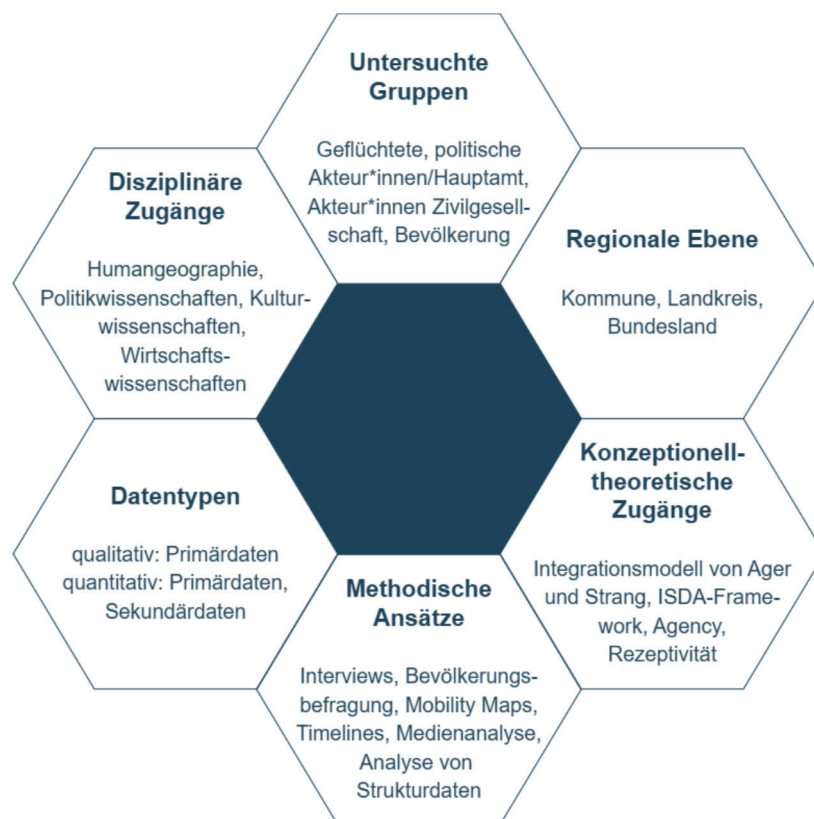
Abbildung 2: Überblick über kritische Designvariablen im Forschungsprojekt „ZukunftGeflüchtete“

Für das Projektmanagement setzte der Projektantrag und später der Verlängerungsantrag den formellen Rahmen. Für den Projektantrag wurde in der Vorbereitungsphase eine vereinfachte Risiko- und Stakeholderanalyse durchgeführt. Die Risikoanalyse ermittelte Aspekte, die eine Umsetzung des Projektes hätten verhindern können, wie fehlende Offenheit in den zu untersuchenden Landkreisen. Ergebnisse der