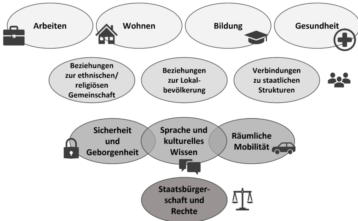
Abbildung 1: Dimensionen von Integration nach Ager and Strang