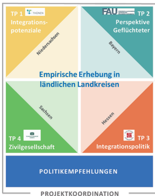
Abbildung 3: Darstellung der inhaltlichen und regionalen Zuständigkeiten je Projektpartner*in und Teilprojekt (TP) sowie der übergeordneten Aufgaben

Das Projektteam bestand aus vier Teilprojektteams. Es waren insgesamt 17 Wissenschaftler*innen und weitere studentische Mitarbeiter*innen aus drei Universitäten und einer außeruniversitären Forschungseinrichtung beteiligt. Der Projektbeirat mit Vertreter*innen aus Wissenschaft, Politik und Praxis begleitete das Projektteam über die gesamte Projektlaufzeit. Er diente als externer Impulsgeber zur Validierung der Forschungsarbeiten und der Handlungsempfehlungen.